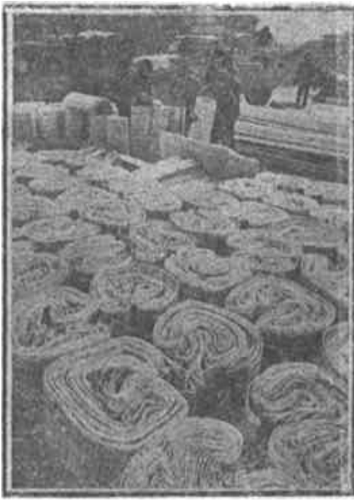
△ 东营市工艺美术公司工艺品厂，去年苇帘出口创汇25万元，图为群众踊跃交售苇帘。